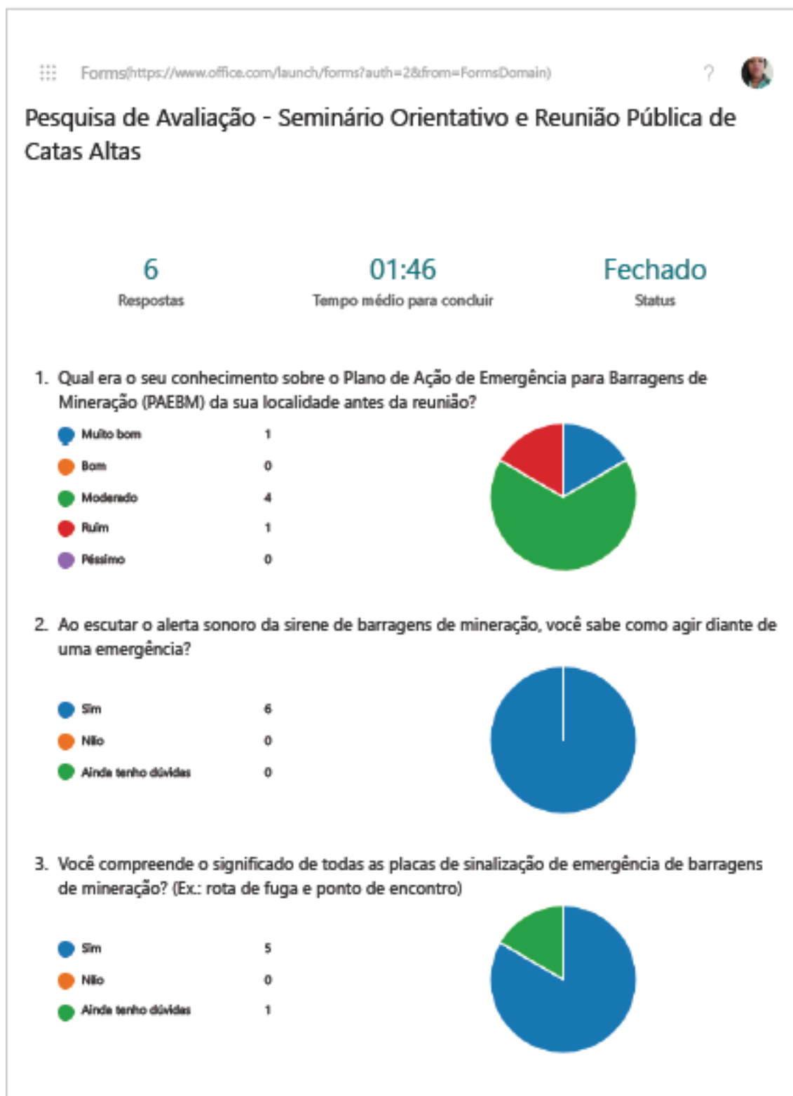
Figura 2: Resposta da Pesquisa de Participante